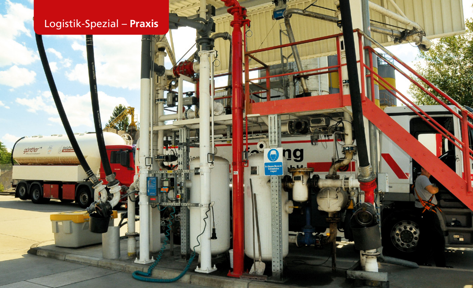
Tkw-Beladung – wahlweise Obenbefüllung oder per Bottom-Loading.