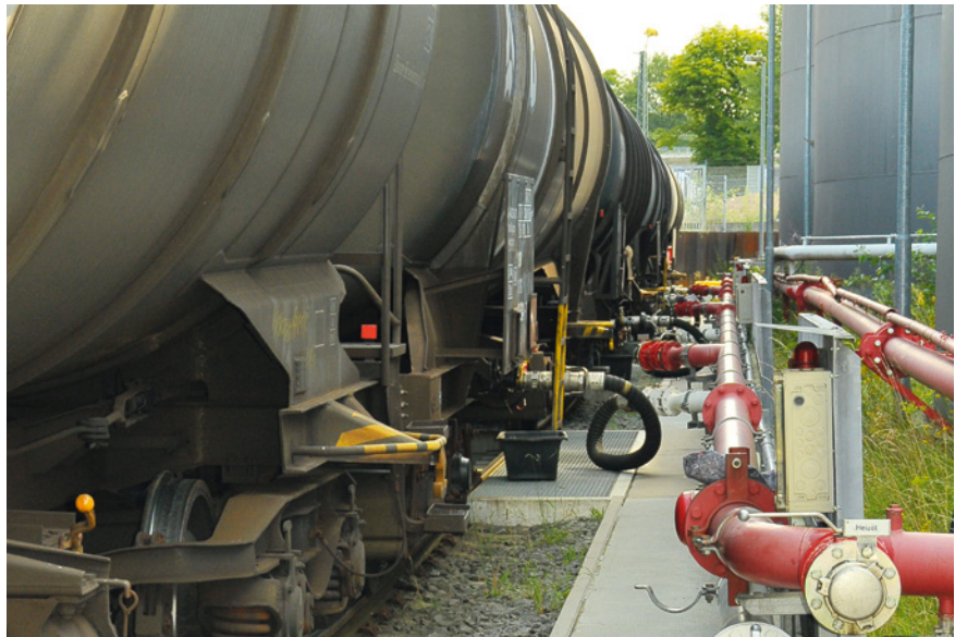
Das Tanklager wird per Bahn beliefert.